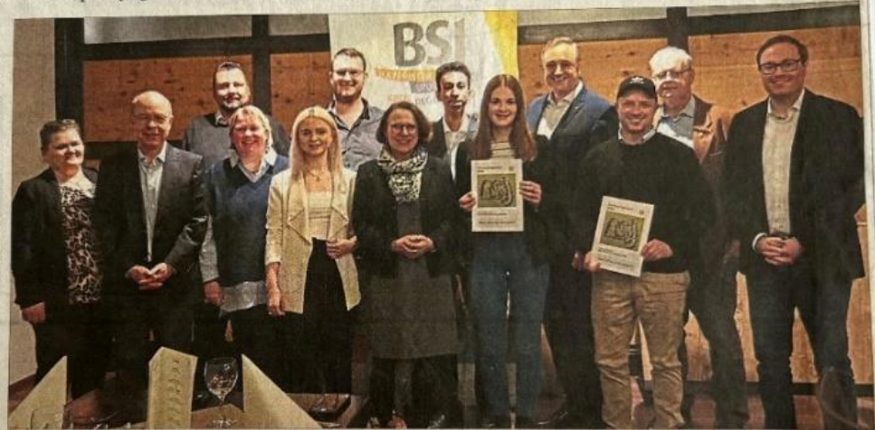
Der Regensburger Kreisverband der bayerischen Sportjugend will sich 2024 besonders intensiv für die demokratische Frühbildung einsetzen.

Gerade der Sport müsse sich gegen den Rechtsextremismus starkmachen, beteuerte Detlef Staude. Schon in der NS-Zeit waren Turnvereine ein Vehikel der Nazis, um den Nachwuchs zu militarisieren und wehrfähig zu erziehen. „Damals ging es nur darum, Kanonenfutter für das Ende des Weltkrieges zu rekrutieren“, so Staude. Das