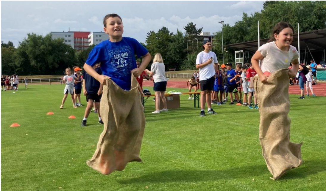
Einfache Spiele wie Sackhüpfen machen immer wieder Spaß.