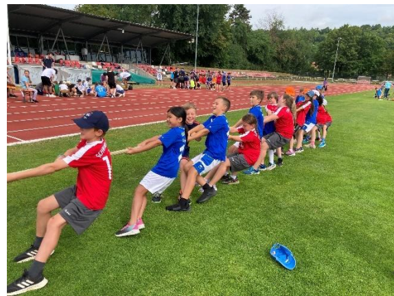
Spiel ohne Grenzen ist immer eine tolle Teamarbeit

Altstadtlauf – Start am Oberen Wöhrd am Sonntag, 13. Juli um 10:00 Uhr Veranstalter: BLSV-Kreis Regensburg