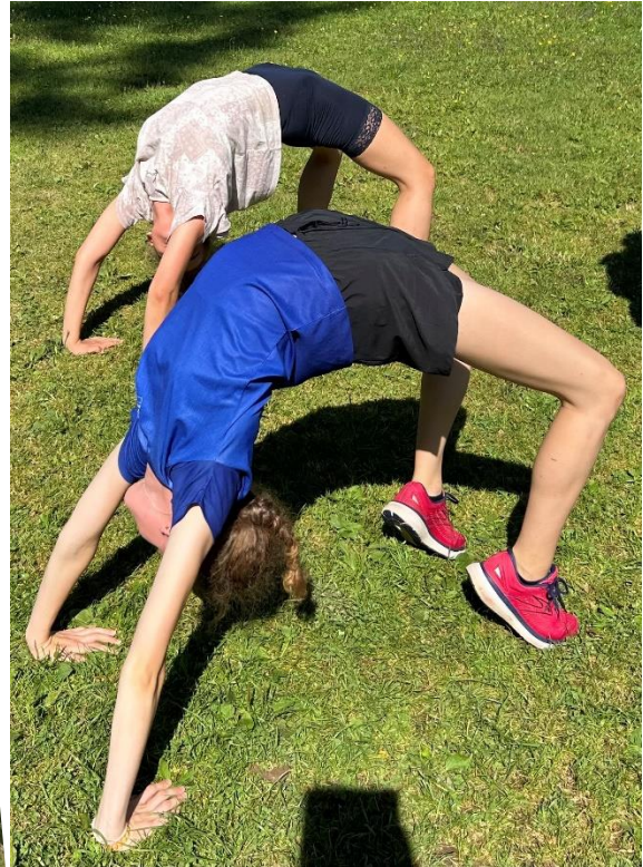
Bilder aus 2024 von Aktivitäten der Sportjugend Regensburg