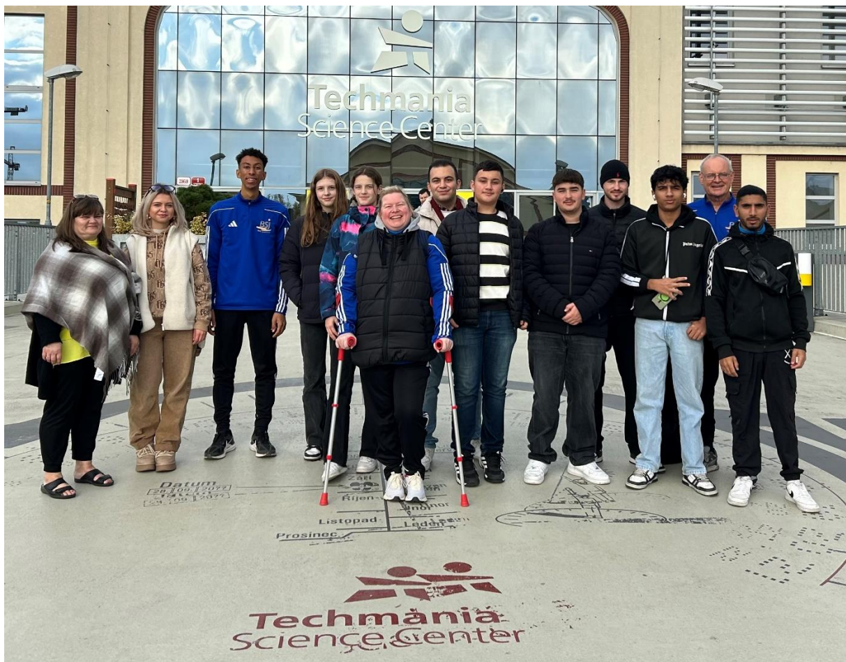
Internationale Jugendfahrt in die tschechische Partnerstadt Pilsen im November 2024