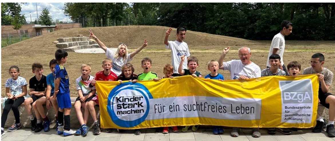
Kinder stark machen – die BSJ beteiligt sich jedes Jahr mit einer Aktion.

https://www.jugendherberge.de/gruppen/trainingslager/jugendherbergen-fuer-sportgruppen/