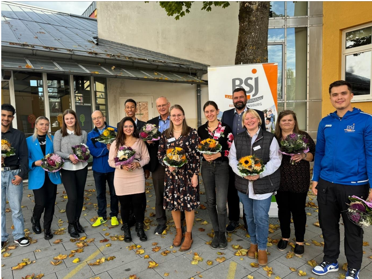
Neue Vorstandschaft der Sportjugend Regensburg (21.10.2023 / Neutraubling)