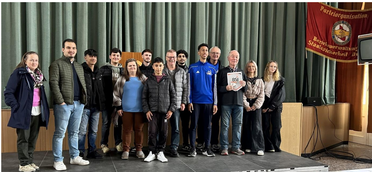
Städtefahrt Dresden 2024 – Gespräch mit einem Zeitzeugen und Führung durch die Gedenkstätte Bautzener Straße

Du findest uns bei Facebook und Instagram !