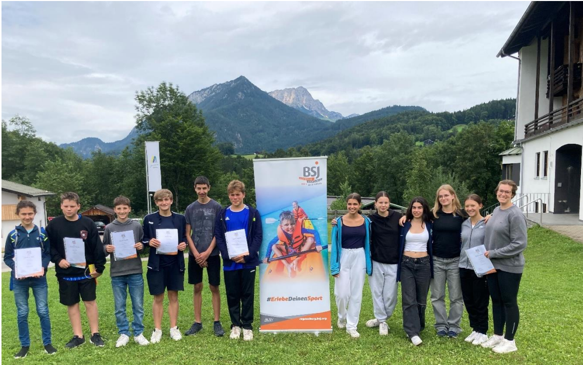
Berchtesgaden – neue Clubassistenten werden mit einer Urkunde ausgezeichnet.

Sommer-Akademie – Clubassistent Ausbildung (JULEICA) – 34 UE vom Samstag, 02. August bis Mittwoch, 06. August für 16 Jugendliche ab 14 Jahre und Betreuer – Jugendherberge Berchtesgaden. Anmeldung: www.blsv-qualinet.de Nummer: 20301CLUBASSIST0125