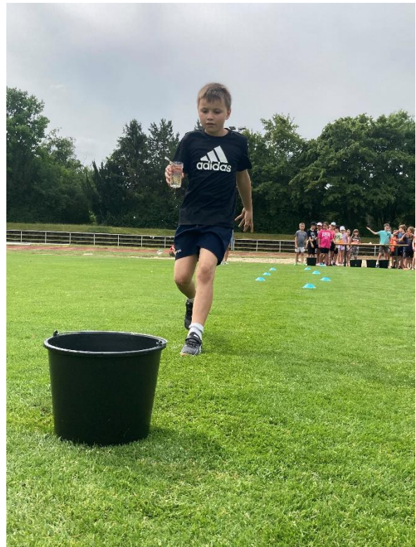
Spiel ohne Grenzen – Bezirkssportanlage am Weinweg in Regensburg