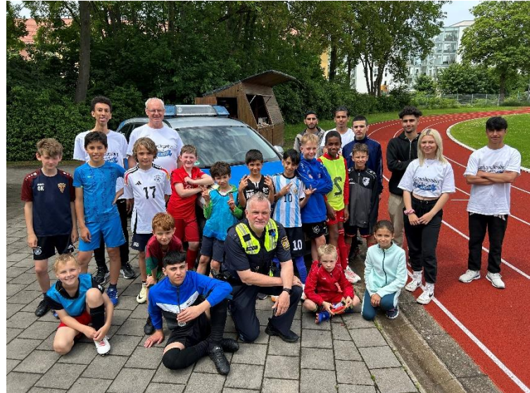
Viele Informationen gibt es von der Polizei