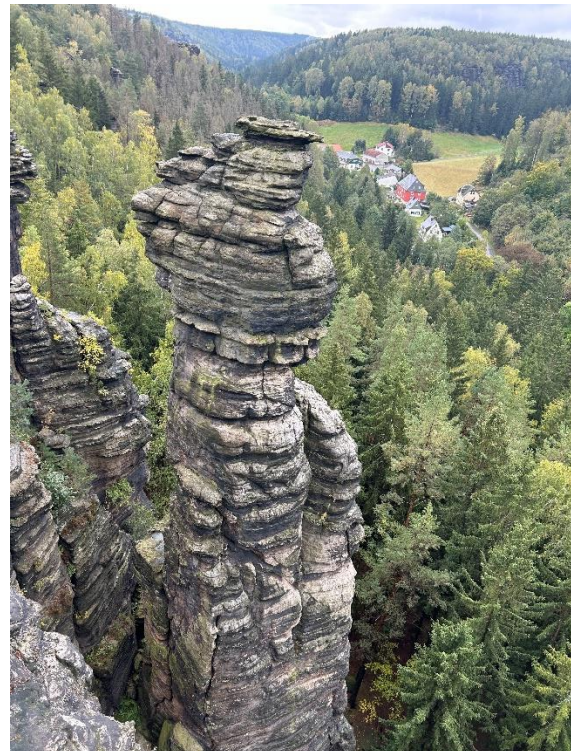
BSJ – unterwegs im Elbsandsteingebirge