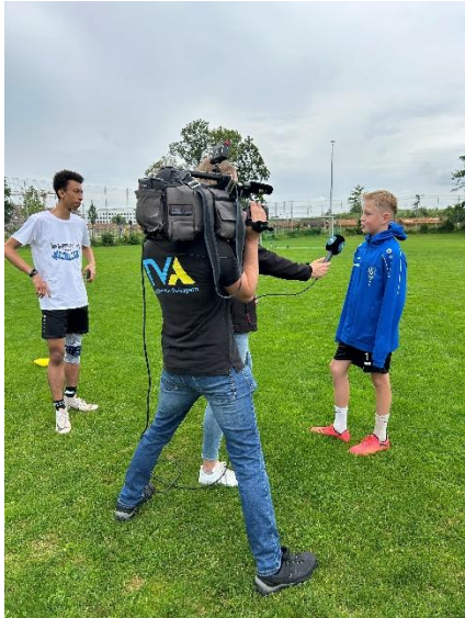
TVA zu Besuch