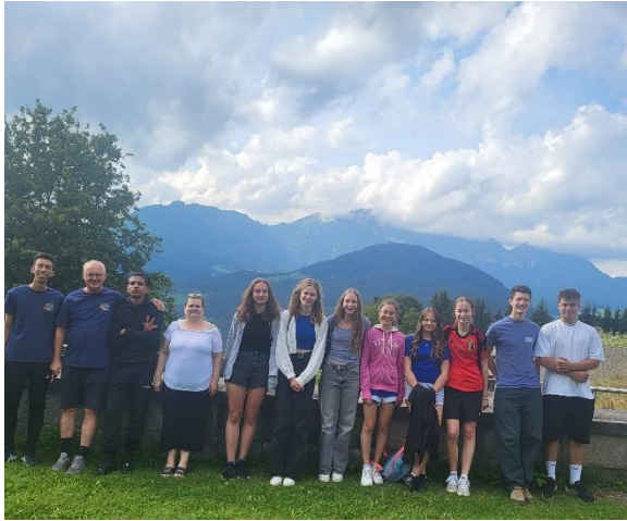
Clubassistent – Ausbildung in Berchtesgaden