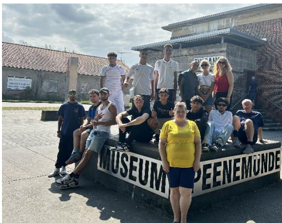
Toleranz und Demokratie: Besuch der historischen Gedenkstätte Peenemünde

Erstmals angeboten wurde 2024 eine Ferienmaßnahme mit einem abwechslungsreichen Bildungsprogramm in der Jugendherberge Greifswald.