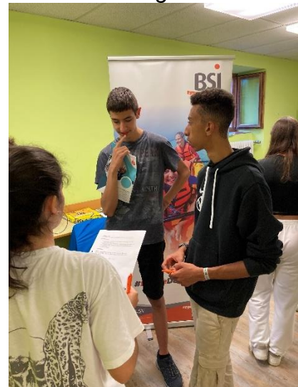
Berchtesgaden: Ausbildung „Clubassistent“ – Praxis, Gruppenarbeit, Spiele u.v.m.