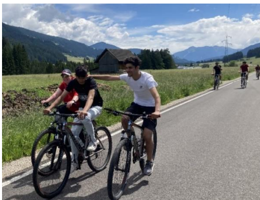
Sportjugend mit dem Rad unterwegs