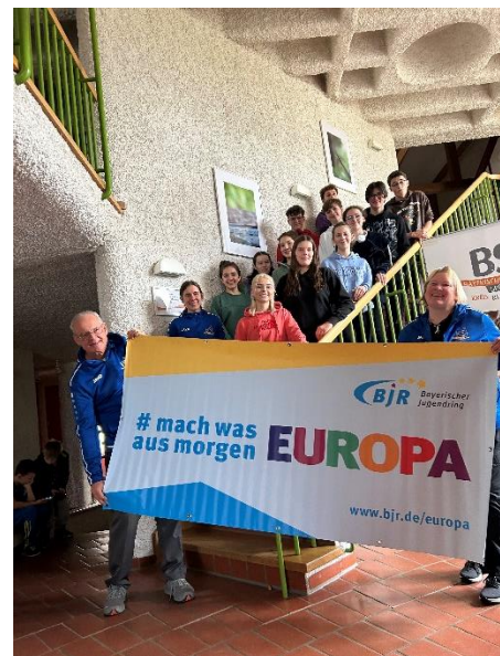
Bilder von einer früheren Veranstaltung in Pottenstein.